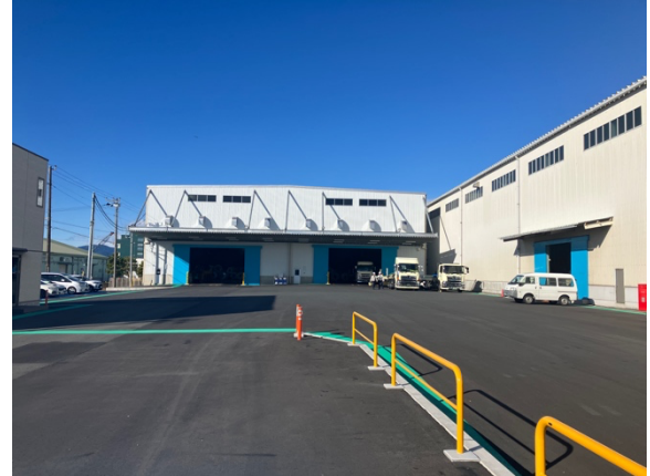
新倉庫の外観とトレーラーなど大型車両の転回スペース

新倉庫は、旧倉庫に引き続き「鋼材」の取り扱いを主として行います。サビ抑制のため換気機能を向上させ、換気用のダクトの増設や東西に大型の開口部を設けるなど、鋼材の品質を維持する機能を向上させました。また重量物の輸送に対応する無人搬送車（AGV）を導入したほか、自動操縦機能を追加可能な天井クレーン 2 基を設置するなど、今後のより高度な省人化を見据えた設備更新を行なっています。安全面では建屋の配置変更に伴い、大型トレーラーの転回スペースを拡大するなど、経験の浅いドライバーでも搬入出しやすくなり、より安心してご利用いただける倉庫となりました。