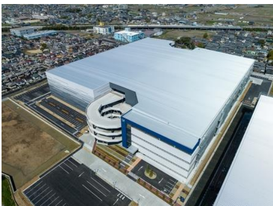
【LF 奈良外観】奈良県では初となるマルチテナント型の物流施設。45 フィートコンテナ車が直接各階に接車可能